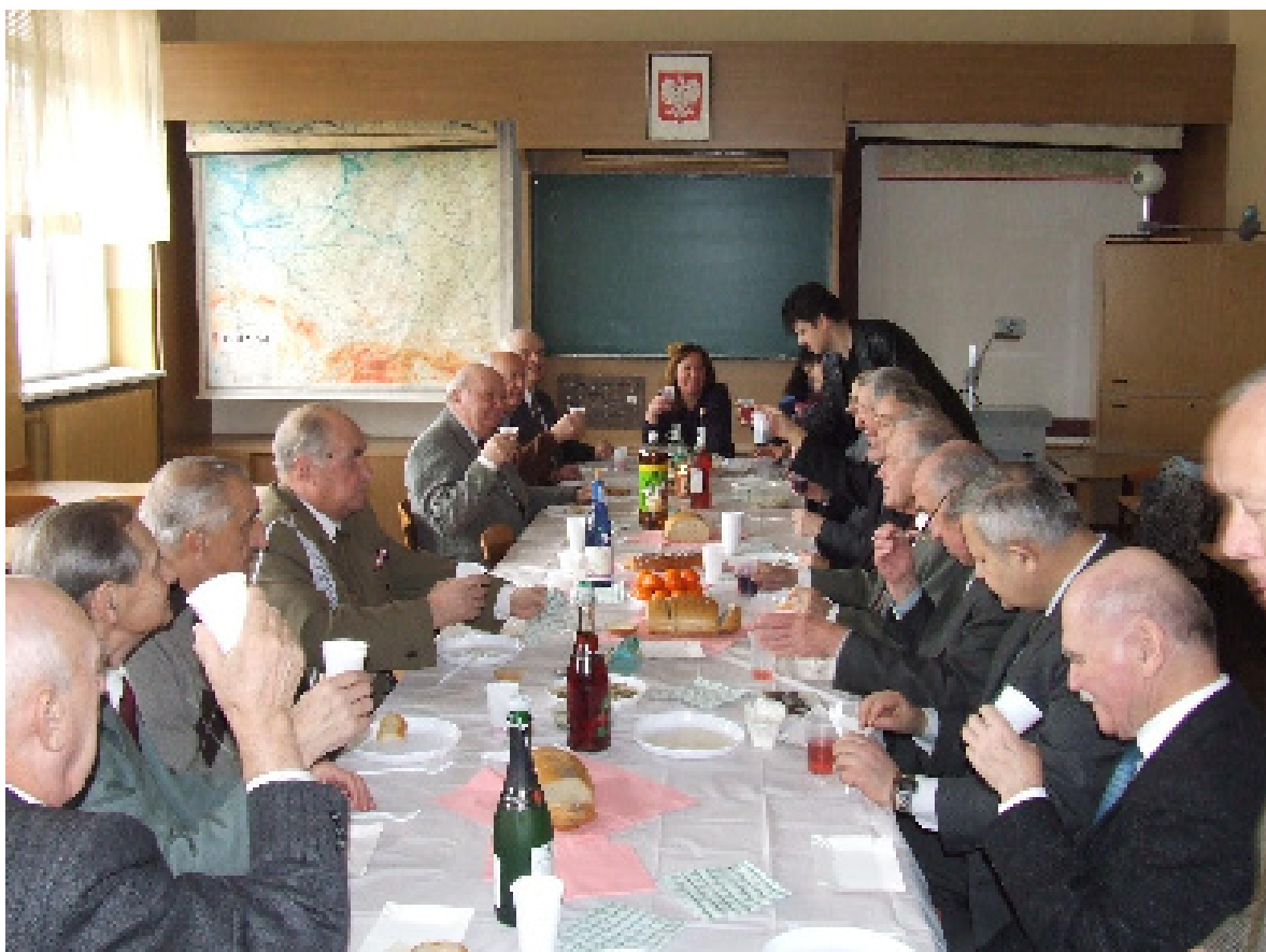
Powspominaliśmy szkolne czasy - miło spędziliśmy czas w gronie „Staszczaków”