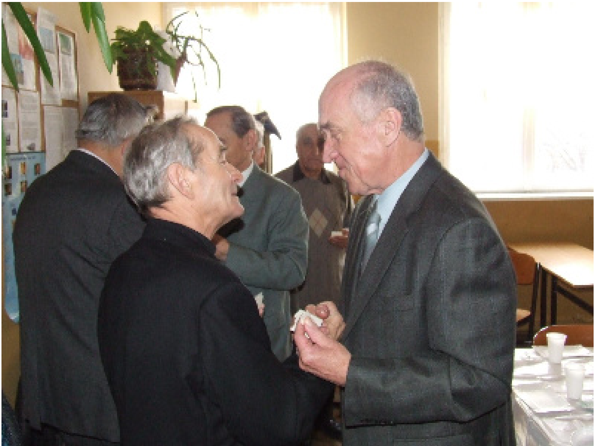
30 grudnia 2006 dzieliśmy się opłatkiem