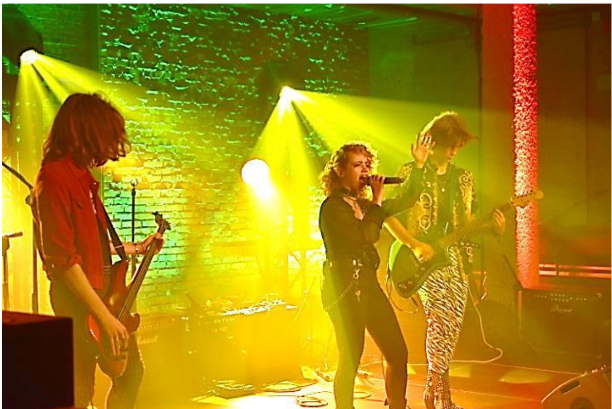
Flowers of the jungle

Flowers of the Jungle , zarazem uniwersalny jak i wyjątkowy zespół łączący hard rock, grunge, funk i wszystko, co gra im w duszy podczas tworzenia łatwo wpadających w ucho i zostających ze słuchaczem na długo utworów. Uderzenie w