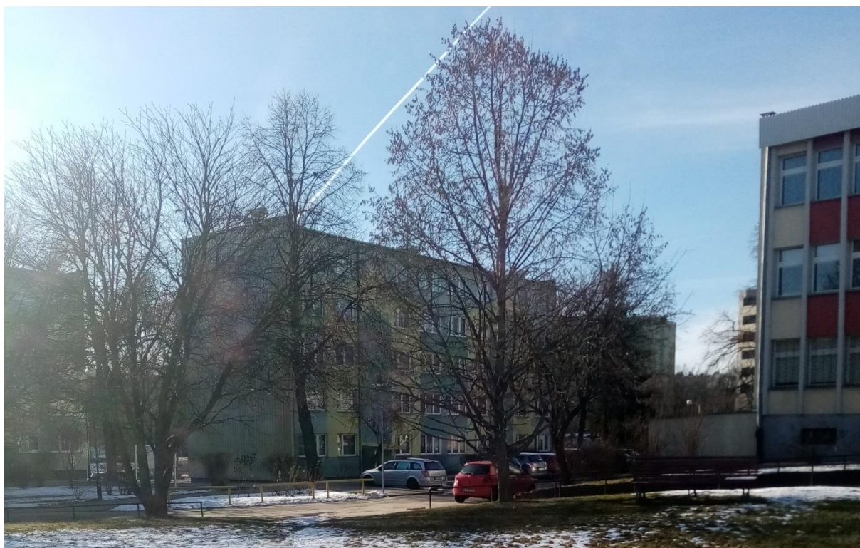
Tereny zielone w pobliżu administracji osiedla

pewien sposób anonimowe. Już od samego początku zarówno zarząd spółdzielni, jak i projektanci, pragnęli uczcić pamięć wybitnych polskich twórców poprzez nadawanie osiedlom ich imion. Dodatkowo, każda z ulic i ważniejszych instytucji znajdujących się na osiedlu, w założeniu miała nosić nazwę związaną z twórczością lub życiem danego twórcy.