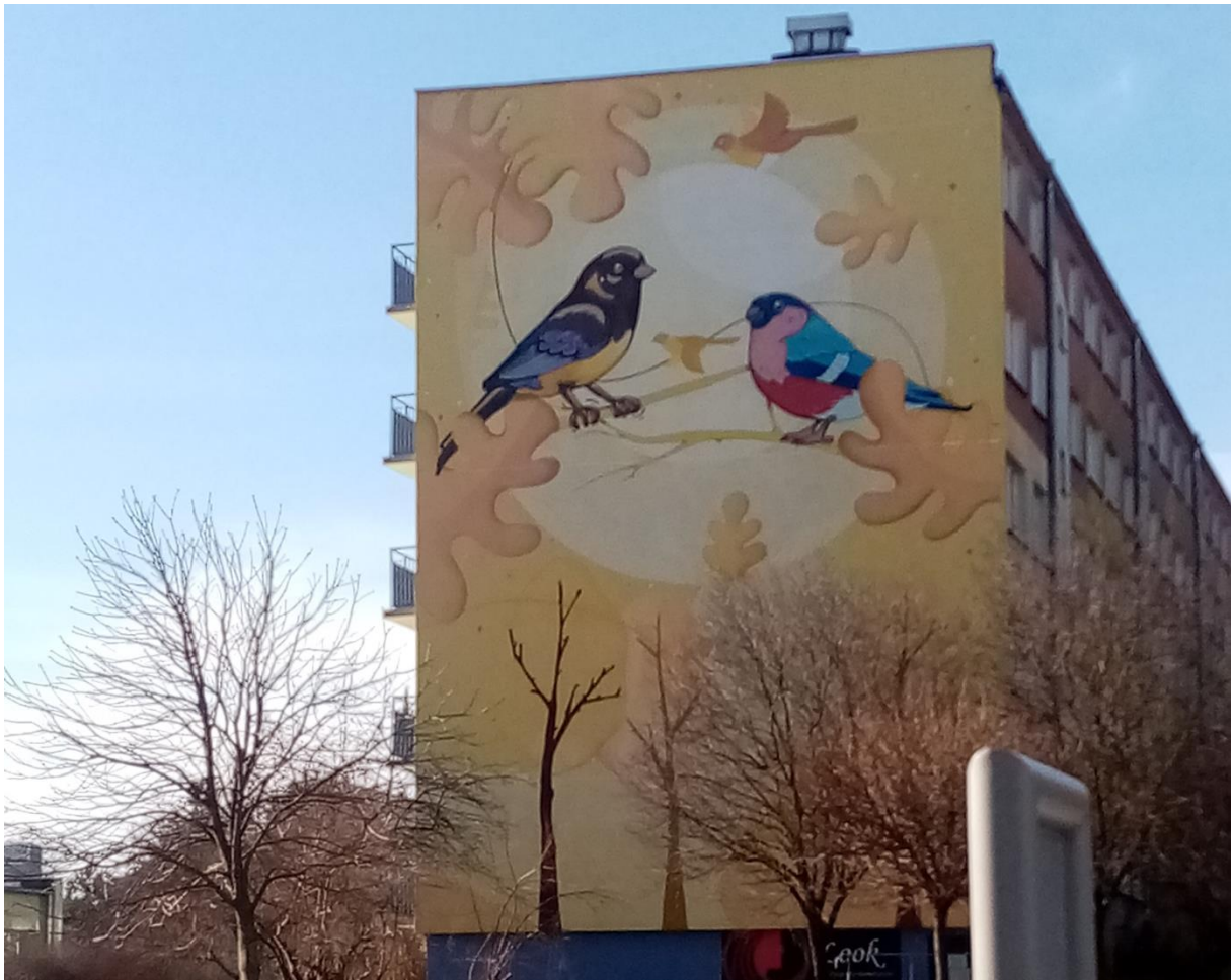
Powyżej mural na bloku przy ulicy Ochockiego. Poniżej widok na wawóz.